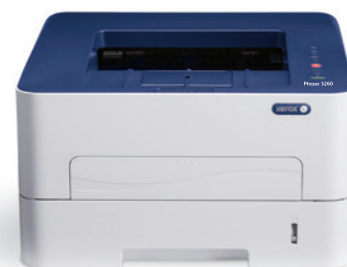
Phaser 3260. Impressão.