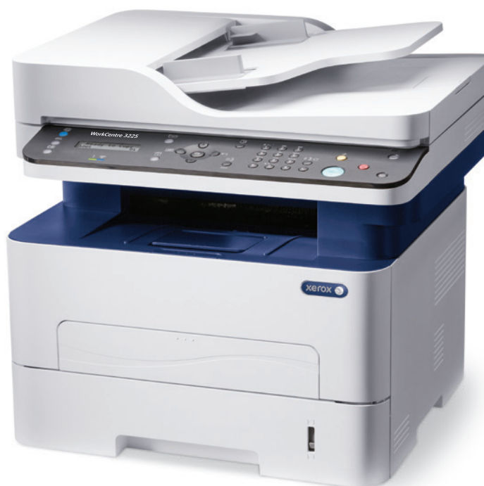
WorkCentre 3225. Cópia. Impressão. Digitalização. Fax. E-mail.